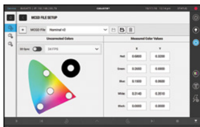
▲ Interfaccia setup file MCGD