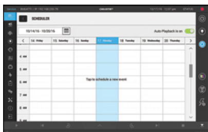
▲ Interfaccia pianificatore

CP2308 è dotato di elettronica Christie® Cinelife™. Caratterizzato da un'interfaccia stile UX dalla struttura snella, CineLife semplifica la riproduzione, la programmazione e la gestione dei contenuti del cinema. Lo schermo integrato per la gestione del sistema consente la gestione dei contenuti e della cabina, KDM, della programmazione playlist, del monitoraggio e di molto altro senza soluzione di continuità. L'impostazione del proiettore è facile e veloce con la funzione di auto-configurazione che regola automaticamente le impostazioni dei proiettori per una riproduzione ottimale, quando sono collegate differenti sorgenti. Progettato pensando all'operatore, CP2308 è il proiettore cinematografico più user-friendly disponibile.